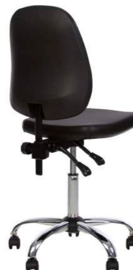
★ MEDICO GTS freelock+ CHR68 V 4