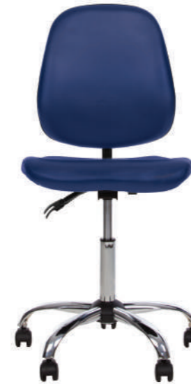
★ MEDICO GTS freelock+ CHR68 V 15