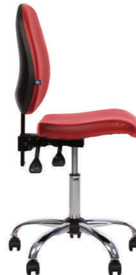
★ MEDICO GTS freelock+ CHR68 V 27