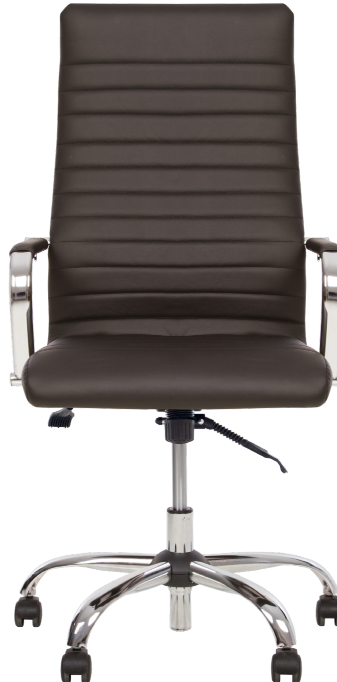
LIBERTY Anyfix CHR68 ECO 30

Фиксация спинки в вертикальном положении | Фіксація спинки у вертикальній позиції | Backrest lock in vertical position