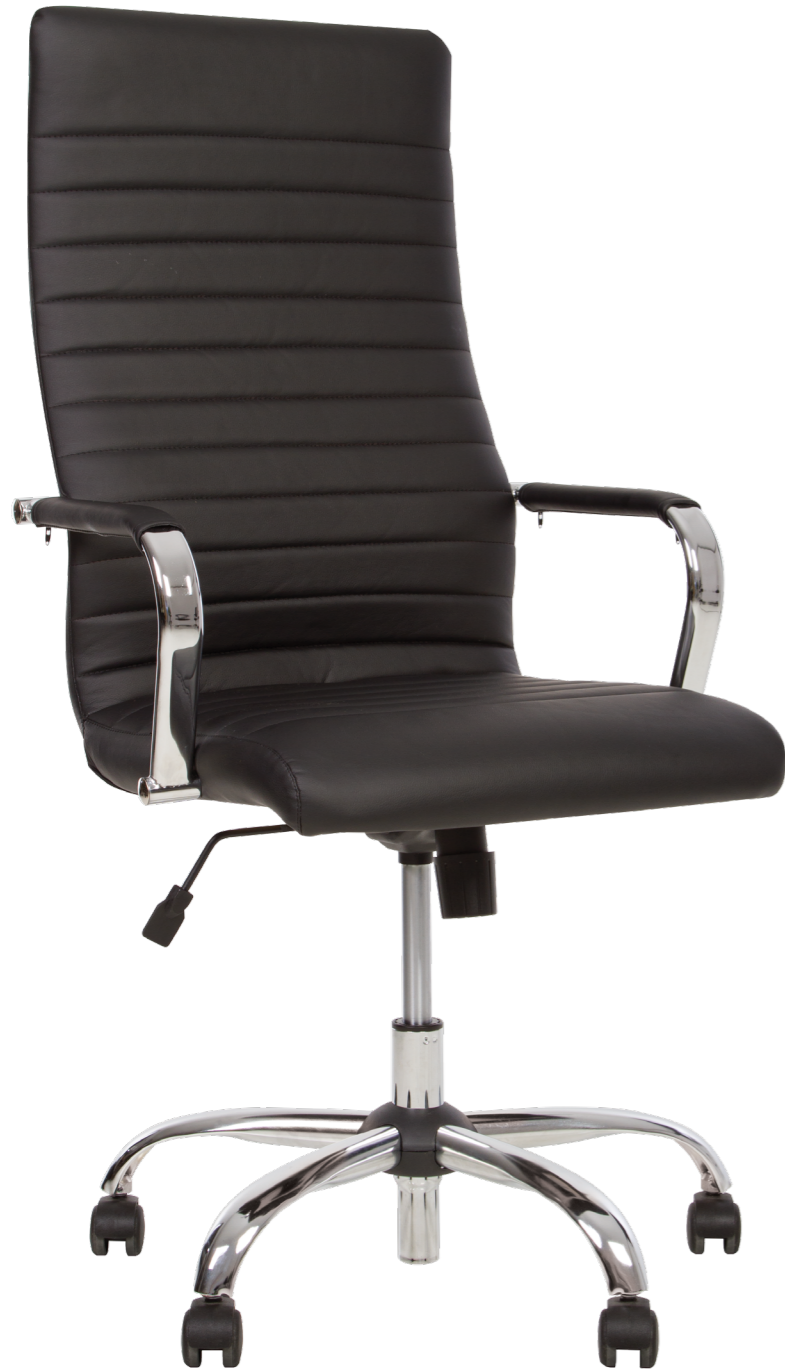
LIBERTY Tilt CHR68 ECO 30

Сидение и спинка | Сидіння та спинка | Seat and backrest Эргономичные | Ергономічні | Ergonomic