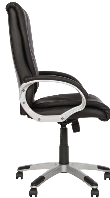
FENIX Tilt PL35