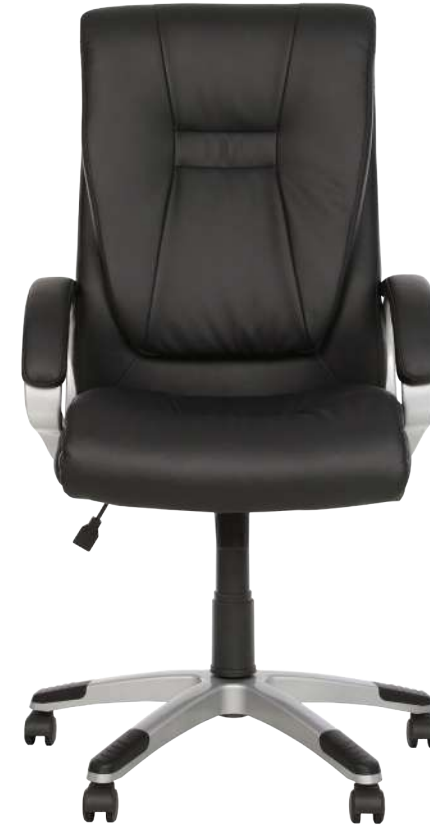
FENIX Tilt PL35