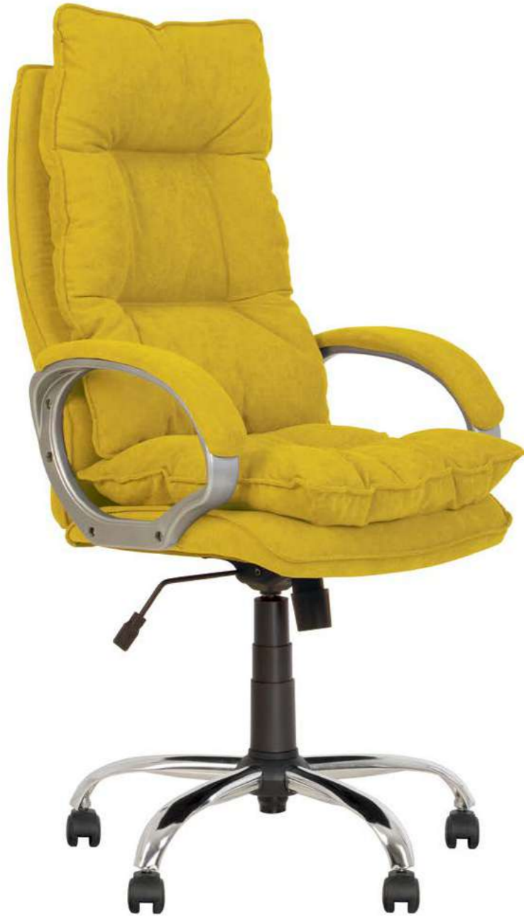
YAPPI Tilt CHR68 SORO 40

С МЕХАНИЗМОМ | 3 МЕХАНИЗМОМ | WITH MECHANISM TILT, ANYFIX