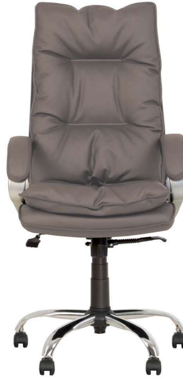
YAPPI Anyfix CHR68 ECO 70